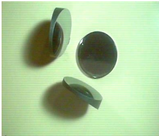
Германієві оптичні елементи з алмазоподібним покриттям