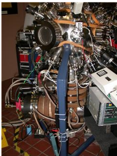
Рисунок 1. Широкоапертурне джерело фільтрованої вакуумно-дугової плазми

та газодинамічного режиму дифузійного насичення в динамічному та статичному газовому середовищі азоту. Наведені приклади розв'язання цих задач шляхом створення та використання: – джерел фільтрованої вакуумно-дугової плазми (рис. 1), які при високій якості очищення плазми від макрочастинок забезпечують малі транспортні втрати плазми і рівномірність товщини покриттів на великій поверхні; – системи створення тліючого розряду, який збуджується шляхом застосування ВЧ-напруги; – пілотної установки для плазмохімічного осадження алмазоподібних вуглецевих плівок а-С:N; – імпульсного джерела живлення, в якому реалізований принцип живлення магнетронної системи біполярним імпульсним струмом складної форми (створена установку ННВ 6.6. И1); – біполярного джерела живлення, яке забезпечує передачу на мішень, що розпилюється, імпульсу позитивної напруги і забезпечує роботу магнетронної системи без дуг навіть на забрудненій мішені; – імпульсного джерела на основі високочастотного генератора з метою стимуляції осадження і підвищення якості покриттів; – систем вакуумного, газового і температурного контролю, охолодження камери дифузійного насичення.