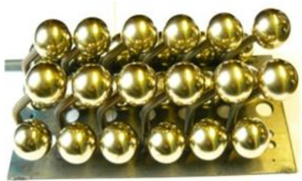
Головки з титану VT1-0 для ендопротезів кульшового суглоба людини