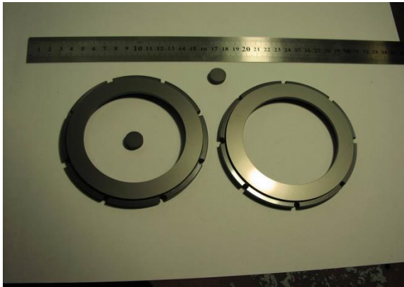
Торцеві кільця з карбіду кремнію з алмазоподібним покриттям