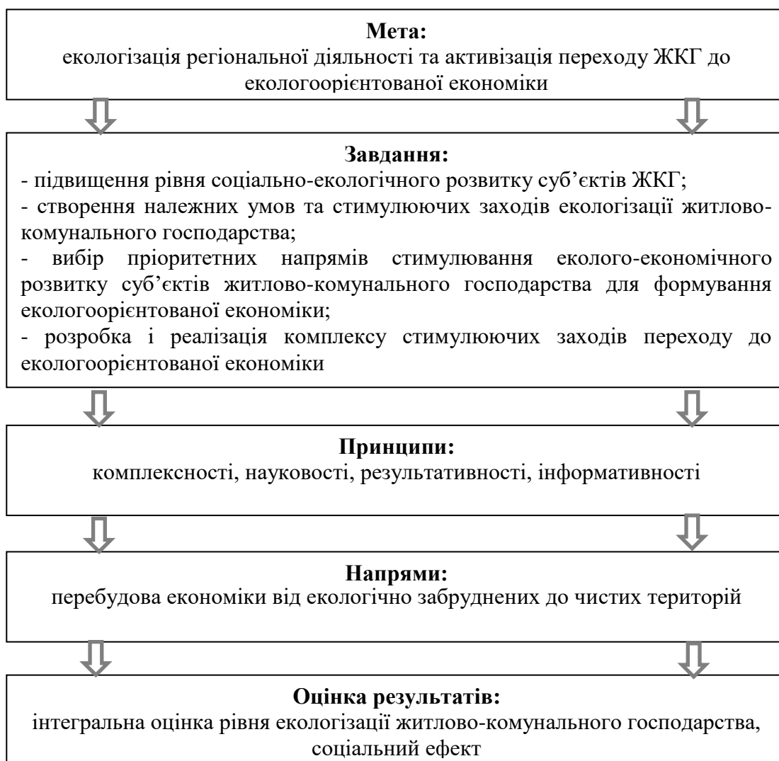
Рис. 1. Концептуальні засади сталого соціально-екологічного розвитку житлово-комунального господарства регіонів (розроблено авторами)

наукових доповідей «Принципи механізму забезпечення стійкого розвитку міст та агломерацій» та «Досвід зарубіжних країн у процесі досягнення стійкого розвитку міст та агломерацій» на конференціях різних рівнів.